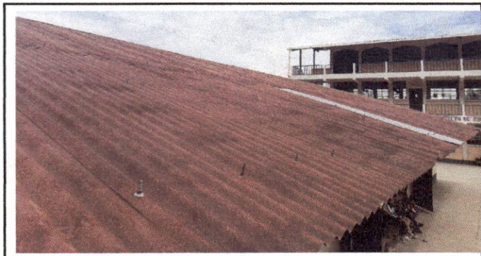
Foto1: SUSTITUCIÓN DE LAMINA PARA LAMINA TROQUELADA AZULIC CALIBRE 26